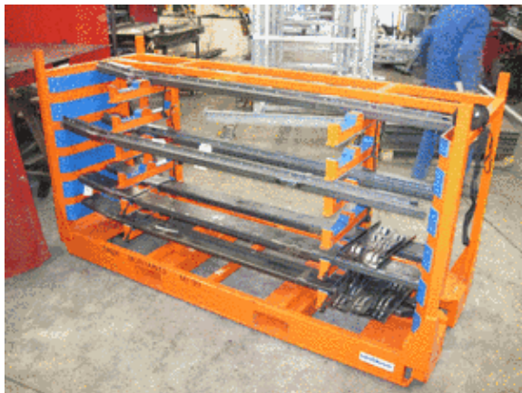
Anwendungsbeispiel: Ladungsträger für lackierte Querträger

Sie sind langlebiger als aufgeklebte Schaumstoffe oder andere Materialien und lassen sich problemlos verformen, ohne dass die Verbindung zwischen Blech und Kunststoff beeinträchtigt wird. Durch hervorragende Rückstelleigenschaft der verwendeten Kunststoffe ist gewährleistet, dass das Verbundblech schon nach kurzer Zeit seinen Ursprungszustand wieder erlangt.